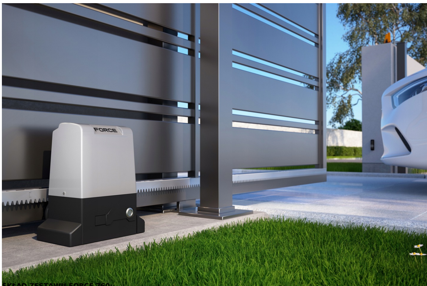
SKŁAD ZESTAWU FORCE 760: