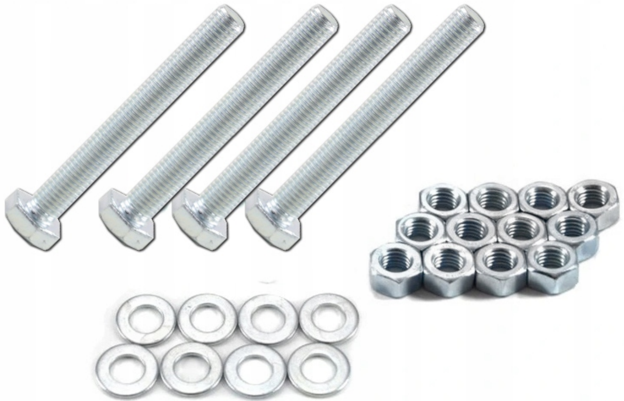
Uchwyty montażowe do wyłączników magnetycznych