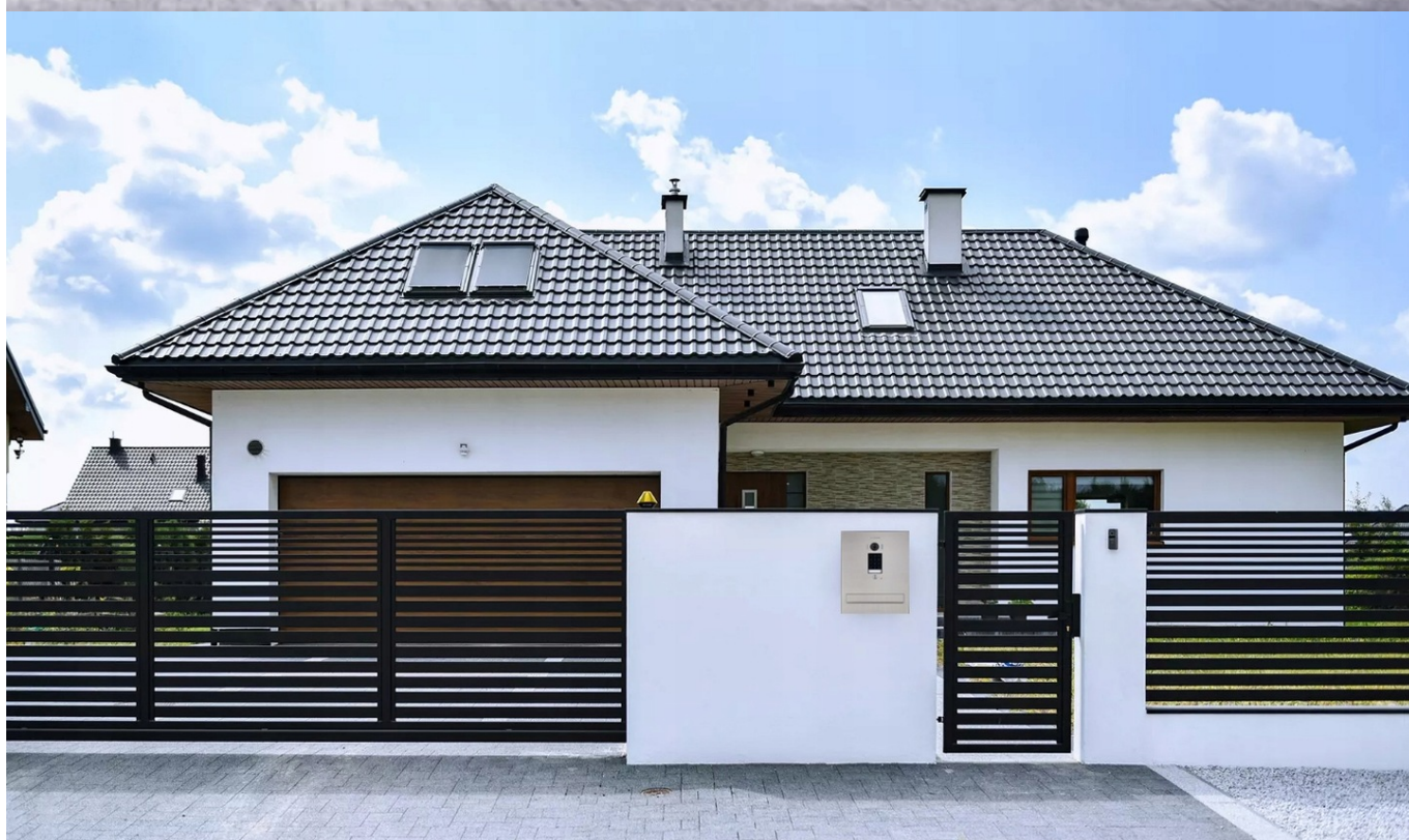
□ Monitor wideodomofonu M1021W □